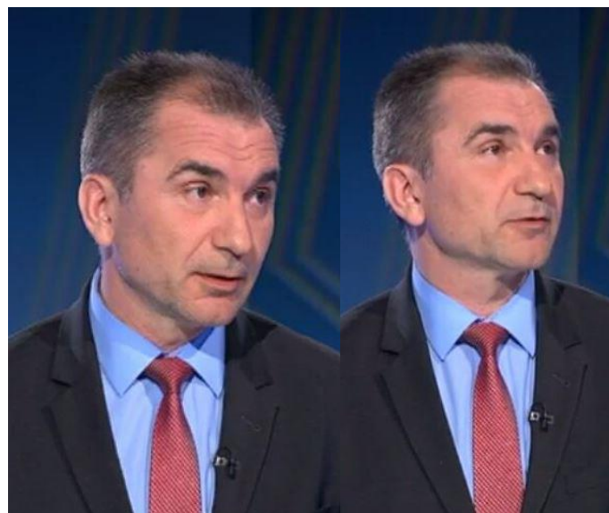
Slika 18: »Otroški pogled in zasanjanost« pri J. V.

Telesna drža ministra za obrambo J. V. je pokončna, naravna, oseba pa deluje zelo samozavestno. Roke so naslonjene na mizo, na obrazu pa ima skoraj ves čas intervjuja opazen nasmeh s »stisnjenimi usti«, pri tem pa tudi rahlo dvigne obrvi, s čimer želi voditeljici natančno opisati nastalo situacijo. Ko se z voditeljičinim vprašanjem ali komentarjem ne strinja, rahlo spusti obrvi – kar kaže na gospodovalnost in napadalnost – in pogled usmeri navzdol, kot da bi hotel premisliti, kaj bo povedal v nadaljevanju. Njegove oči so ves čas pogovora široko odprte in ustvarjajo vtis »otroškega obraza«. Med sogovorcema je vzpostavljen očesni stik, vendar intervjuvanec pogosto pogleduje proti stropu (desno navzgor) in na mizo (levo navzdol). Pogled navzgor pomeni, da se oseba spominja nečesa, kar je videla, pogled navzdol pa kaže na obujanje spominov na občutke ali čustva (Pease 2008: 182).