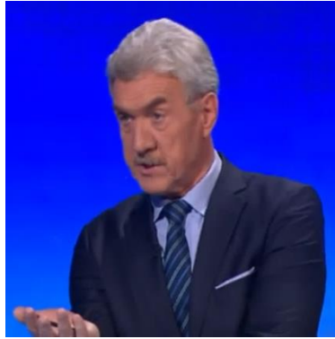
Slika 7: Kretnja »navzgor obrnjene dlani«

Ponavadi gostje nastopijo v studiu takoj po novici, zato se lahko zgodi, da kamera gosta ujame v nepravem trenutku oz. v trenutku nepripravljenosti. Tako se je zgodilo dr. B. K., ki roke sprva drži v žepu, kar je izrazito negativna kretnja in pomeni, da ne želi sodelovati v pogovoru. Takoj ko mu voditelj zaželi »dober večer«, se zave svoje neprimerne kretnje, zato roke nasloni na mizo/pult. Ko želi voditelju posredovati jasen odgovor oz. želi nekaj dodatno pojasniti, uporabi kretnjo »skrčenja palca proti konicam drugih prstov«. Njegov pogled ni usmerjen neposredno k voditelju, ampak pogleduje k mizi in LCD zaslonu, nekajkrat pa tudi v daljavo. Voditelj ga pri odgovarjanju zavzeto posluša, pri tem pa uporabi kretnjo »prekrižanih rok na prsih« oz. ena roka je na prsih, s kazalcem druge roke pa se dotika ust. Voditelj se z levo roko večkrat dotakne pulta, pri tem pa gledalcu kaže »navzdol obrnjeno dlan«, s čimer deluje avtoritativno.