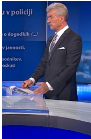
Slika 3: Premikanje tehnične opreme na mizi