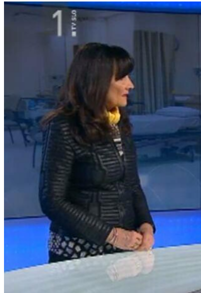
Slika 16: Nenaravna telesna drža