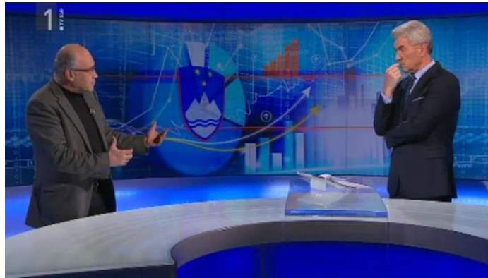
Slika 9: Kretnja »prekrižane roke« pri S. B. in kretnja »dodatnega pojasnila« pri govorcu

Naslednja gostja U. B. ves čas intervjuja uporablja krettnjo »pokvarjene zadrge«, kar je zelo dolgočasno, prikupen nasmešek na obrazu pa sporoča, da ji gledalci lahko zaupajo in verjamejo njenim odgovorom.