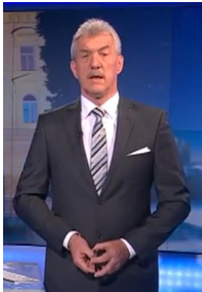
Slika 1: Voditelj S. B.

S. B. velja za enega najbolj prepoznavnih novinarjev in voditeljev v slovenskem televizijskem prostoru. Njegova karierna pot obsega 30 let dela v dnevnoinformativnem programu Televizije Slovenija. Je ustanovitelj koroškega dopisništva TV SLO. Za novinarske prispevke in voditeljsko delo je prejel številne nagrade (Vornšek 2013: 7). V trideset letih novinarskega ustvarjanja je S. B. pomembno zaznamoval slovenski televizijski prostor. Iz novinarja dopisnika se je v eno najprepoznavnejših slovenskih televizijskih osebnosti razvil predvsem zaradi svojih osebnih značilnosti, ki se odražajo v stilu poročanja – bil je opazno drugačen že od prvega dne (Vornšek 2007: 73). To njegovo drugačnost in predanost svojemu delu ponazarja tudi njegov moto: »Ne bodi kot drugi.« (Bobovnik 2015.)