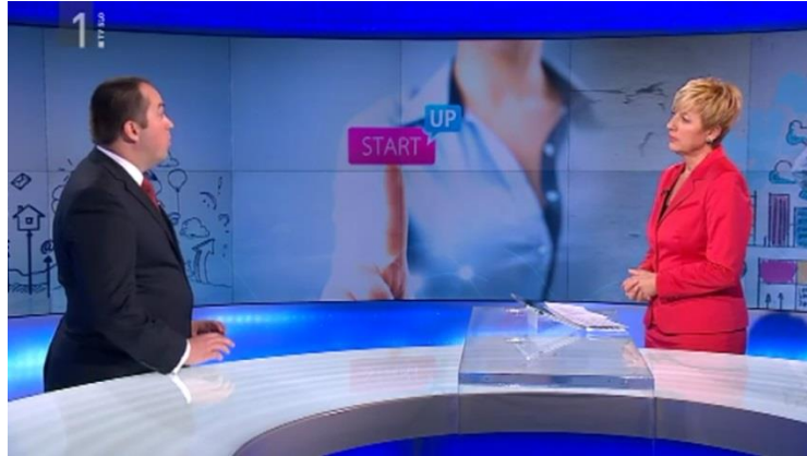
Slika 19: Gost z mimiko obraza poskuša prikazati čim bolj zanimive odgovore, voditeljica pa ga pri tem pozorno posluša

svojem odgovoru pa je njegov pogled usmerjen navzdol. Odgovori na vprašanja so jasna, jedrnata, vidi se, da je oseba zelo izobražena na svojem področju in ve, kaj govori. Na koncu se celo pošali, s čimer vzpostavi prijetno in sproščeno vzdušje. Voditeljica je z njegovimi odgovori več kot zadovoljna, kar kaže z mimiko obraza (nasmeh) in enostavnimi vprašanji.