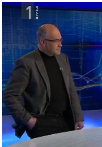
Slika 8: Kretnja »roke v žepu«

Ponavadi gostje nastopijo v studiu takoj po novici, zato se lahko zgodi, da kamera gosta ujame v nepravem trenutku oz. v trenutku nepripravljenosti. Tako se je zgodilo dr. B. K., ki roke sprva drži v žepu, kar je izrazito negativna kretnja in pomeni, da ne želi sodelovati v pogovoru. Takoj ko mu voditelj zaželi »dober večer«, se zave svoje neprimerne kretnje, zato roke nasloni na mizo/pult. Ko želi voditelju posredovati jasen odgovor oz. želi nekaj dodatno pojasniti, uporabi kretnjo »skrčenja palca proti konicam drugih prstov«. Njegov pogled ni usmerjen neposredno k voditelju, ampak pogleduje k mizi in LCD zaslonu, nekajkrat pa tudi v daljavo. Voditelj ga pri odgovarjanju zavzeto posluša, pri tem pa uporabi kretnjo »prekrižanih rok na prsih« oz. ena roka je na prsih, s kazalcem druge roke pa se dotika ust. Voditelj se z levo roko večkrat dotakne pulta, pri tem pa gledalcu kaže »navzdol obrnjeno dlan«, s čimer deluje avtoritativno.