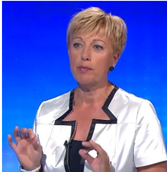
Slika 15: Kretnja »krogec s palcem in kazalcem«