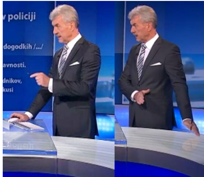
Slika 2: Kretnja »uperjenega prsta« in »dodatnega pojasnila« pri voditelju