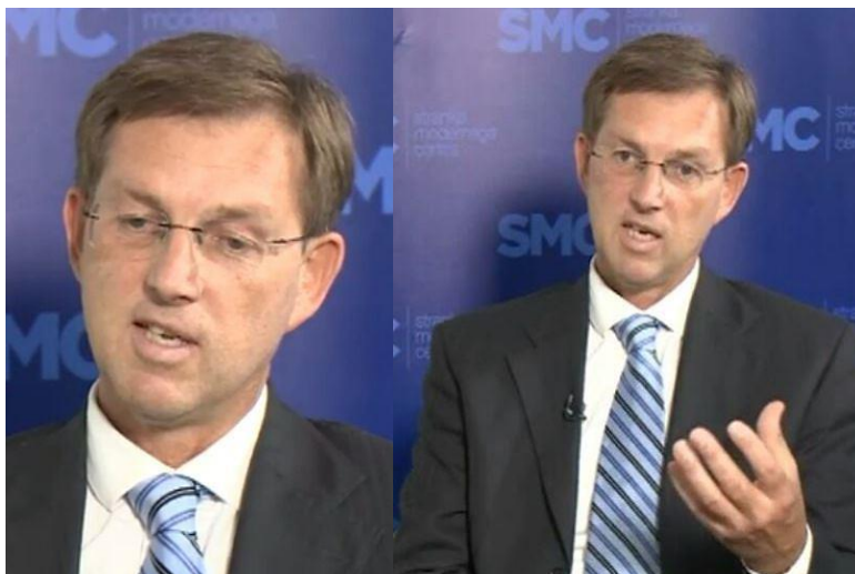
Slika 10: Pogled navzdol in kretnja »dodatnega pojasnila« pri M. C.