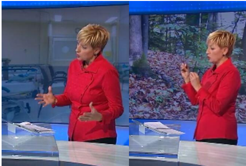
Slika 14: Kretnje »dodatnega pojasnila«

S sogovorniki je voditeljica vedno v odprtem položaju, kar izraža pripravljenost na sodelovanje v pogovoru, vzpostavljen pa je tudi očesni stik, ki je eden glavnih kriterijev, da se pogovor sploh lahko vzpostavi. Voditeljica med pogovori uporablja krettno t. i. »spuščenega zvonika«, kar pomeni, da se konice prstov obeh rok rahlo stikajo in drži rok spominja na vrh cerkvenega zvonika. Za razliko od navadnega zvonika, so konice prstov pri R. P. obrnjene proti sogovornici, kar pomeni, da voditeljica zaupa vase. Večkrat uporabi tudi krettno »sklenjenih rok v srednjem položaju«, krettno »dodatnega pojasnila«, med intervjuji pa se z desno roko naslanja na mizo, levo dlan pa usmeri navzdol proti sogovorniku, kar kaže na izražanje avtoritativnosti ali pa želi sogovornika nekoliko »umiriti« ali pa celo prekiniti. Ko sogovornika prekine se opraviči, nato pa nadaljuje z vprašanjem. Menjavanje vlog, ki je v komunikacijskem procesu pomembno načelo, torej poteka na zelo kultiviran način, saj ne prihaja do molka ali tekmovalnega hkratnega govora (Kranjc 2003: 307).