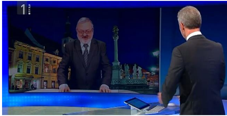
Slika 5: Pogovor z gostom, ki ni v studiu