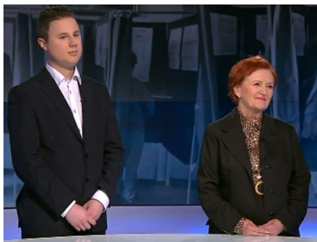
Slika 6: Položaj »pokvarjene zadrge« pri levem govorcu