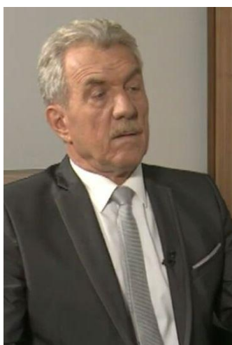
Slika 11: Privzdignjena glava in pogled navzdol k sogovornu

Voditelj naslednji gost je dr. I. M. iz Ekonomske fakultete v Ljubljani. Njegove kretnje rok so podobne kot pri prejšnjih gostih. Roke so sklenjene in naslonjene na mizo, večkrat uporabi kretnjo »dodatnega pojasnila«, telesna drža deluje nekoliko nenaravno, izraz na obrazu pa je resen in pripravljen na voditeljeva vprašanja.