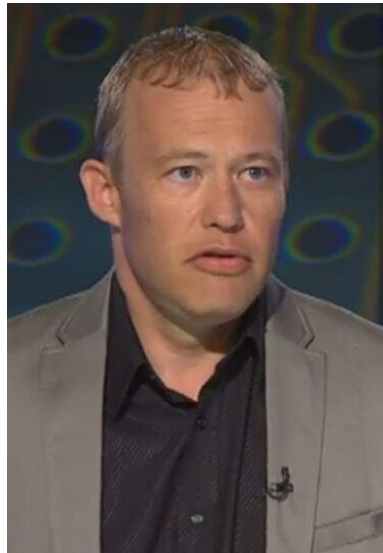
Slika 20: »Račja glava« pri M. L.