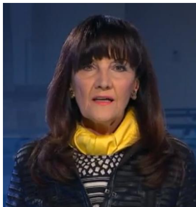
Slika 17: Gostja gleda v kamero in nagovarja gledalce