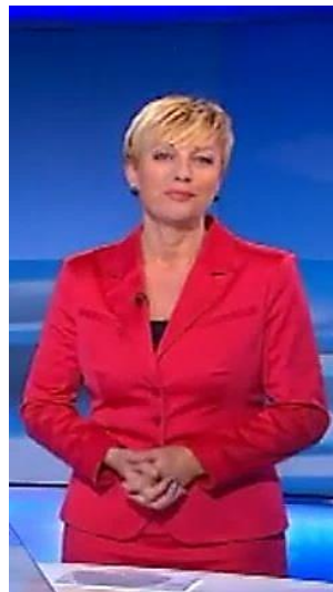
Slika 13: Kretnja »sklenjenih rok« pri R. P.

Najpogostejša kretnja voditeljice je kretnja »sklenjenih rok«. Ta je nekoliko drugačna kot pri voditelju S. B., saj roke niso stisnjene v pest, ampak je kretnja podobna rokovanju. Voditeljica je med napovedovanjem novic/zgodb, ki jih bodo obravnavali v oddaji, zelo resna, na kar kaže njen pogled, pa tudi na obrazu ni najmanjšega nasmeha. Slednji se ji izriše samo ob napovedovanju lahkotnejših tem, kot je na primer dosežek Petra Prevca v Planici 14 . Njena telesna drža je pokončna in deluje naravno, glava je nekoliko privzdignjena, kar kaže na (samo)zadovoljstvo nad izpeljano nalogo oz. nad tem, da se ji je nekaj posrečilo. Pri vodenju si pomaga z listom papirja, ki ga ima ponavadi na mizi, večkrat pa se z njim tudi zamoti. Zunanja podoba je podoba poslovne ženske in je primerna javnemu nastopanju na televiziji. Oblečena je v ženski kostim z dolgimi ali kratkimi rokavi, saj velja, da mora imeti poslovna ženska vedno zakrita ramena, ne glede na modo ali zunanjo temperaturo.