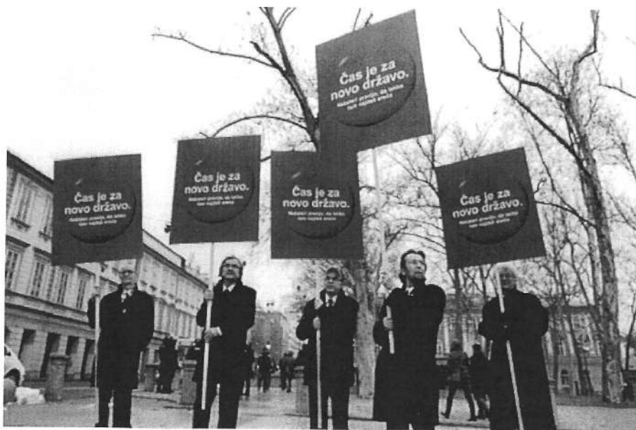
Umetniška skupina IRWIN na vseslovenski ljudski vstaji, Ljubljana, 21. december 2012

Marcel Štefančič jr. | Mladina 1 | 4. 1. 2013