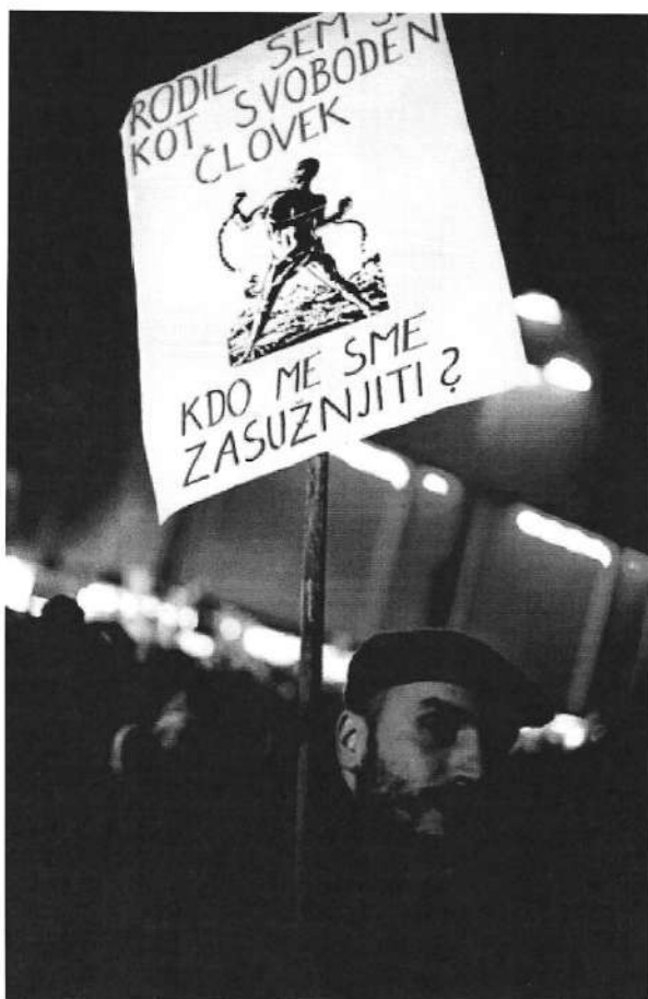
Vseslovenska ljudska vstaja, Ljubljana, 21. december 2012

To je pogoj, trik pa je v temle: »Če ekonomski morilec zabeleži popoln uspeh, so posojila tako visoka, da je dolžnik po nekaj letih prisiljen ustaviti odplačevanje. Ko se to zgodi, tako kot mafija terjamo svoj del plena. To pogosto vključuje eno ali več od naštetega: nadzor nad glasovi v Združenih narodih, izgradnjo vojaških oporišč ali dostop do dragocenih virov, kot sta nafta ali Panamski prekop.« In tako svojemu globalnemu imperiju dodajo še eno državo.