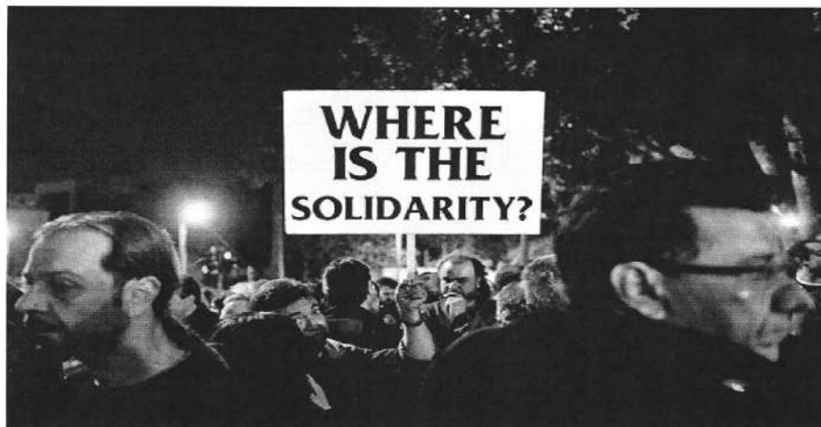
Demonstracije v Nikoziji na Cipru