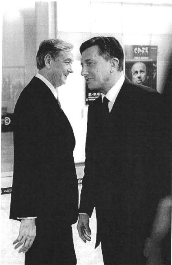
Mimobežnost dveh kandidatov