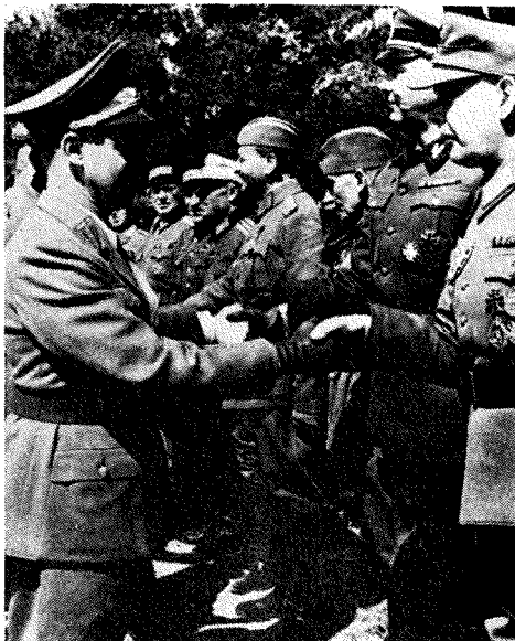
Vrhovni komisar dr. Friedrich Rainer in predstavniki kolaboracionistov na gradu Miramar 20. aprila 1945.

jem v pokrajinah so bili podrejeni domobranski okrožni vodje (Landschutzkreisleiter). Znano je, da sta bila v tržaški pokrajini vsaj dva okrožna vodja, in to v Postojni in Trzinu (Monfalcone), v Istri celo trije, in to za severno Istro v Pazinu, za srednjo Istro v Poreču in za južno Istro v Vodnjanu. Za druge pokrajine ne vemo natančneje, kje so bili domobranski okrožni vodje; za Furlanijo vemo le to, da so bili v Palmanovi, Čedadu, Pordenonu, Tolmeču (Tolmezzo) in v Vidmu in da so bili v goriški pokrajini vsaj trije, in to za severni (Tolmin), zahodni del (Gorica) in vzhodni del (Ajdovščina). Iz nekega vira je razvidno, da so bili domobranski okrožni vodje podrejeni neposredno komandantom SS in policije v pokrajinah, medtem ko so bile domobranske šole podrejene neposredno vodstvenemu štabu za domače oddelke.