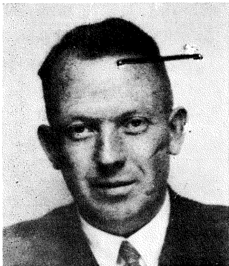
SS-Brigadeführer in generalmajor policije Wilhelm Günther, poveljnik varnostne policije in varnostne službe v Trstu. (Izv. v BDC)

ma, marksizma, ilegale in sovražne propagande, referat IV A 2 se je ukvarjal z zaščito pred sabotажami in z zatiranjem sabotažne dejavnosti, referat IV A 3 se je ukvarjal s t. i. reakcijo, opozicijo, legitimizmom, liberalizmom in emigracijo. Referat B 1 se je ukvarjal s političnim katolicizmom, referat IV B 2 s političnim protestantizmom, referat IV B 3 z drugimi cerkvami in prostozidarstvom, referat IV B 4 pa z zatiranjem Židov in s tehničnimi vprašanji izganjanja nenemškega prebivalstva. Referat IV C 1 je skrbel za politično označevanje ljudi in je vodil kartoteke, referat IV C 2 je bil referat za zapore in pošiljanje ljudi v koncentracijska in delovna taborišča.