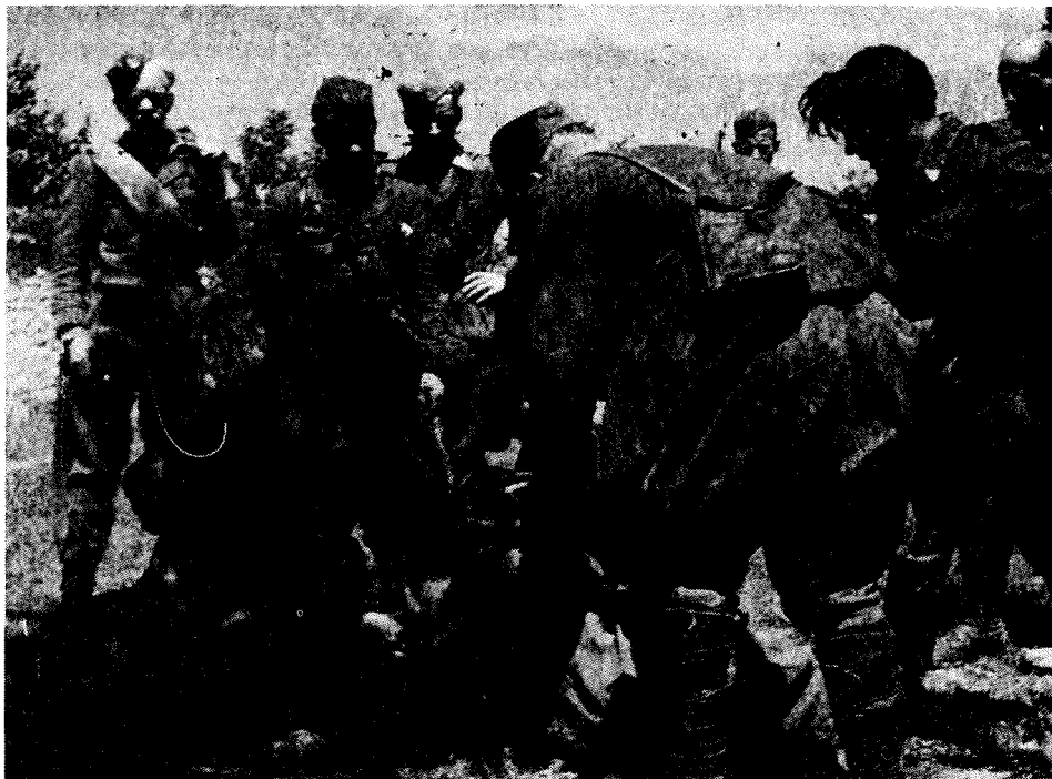
Partizanski bolničar nudi prvo pomoč ranjenemu borcu. Fotografija je nastala v 12. brigadi leta 1944