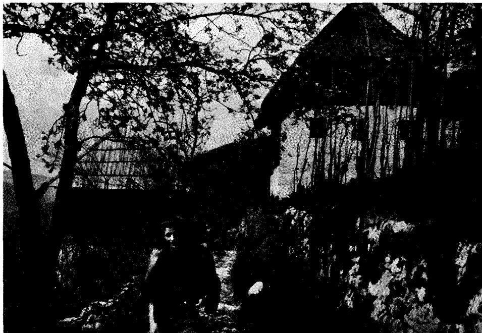
Radiodelavnica na Novi gori, levo kuhinja in pisarna

odseka so si načrtali delovni program, ki so ga v naslednjih mesecih skušali uresničiti.