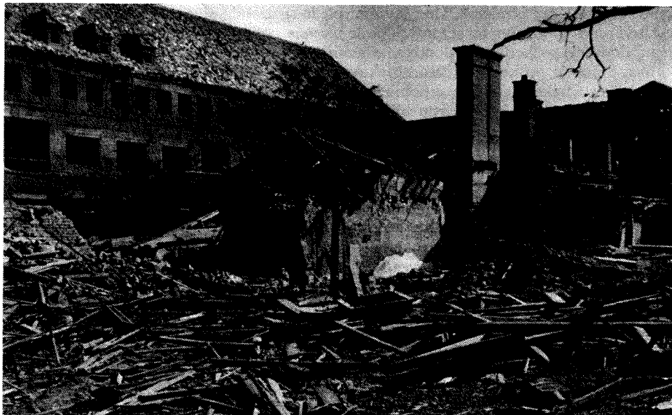
Poslopje mariborske bolnišnice je bilo močno zadeto med bombnimi napadi 14. oktobra in 6. decembra 1944 ter 1. marca in 1. aprila 1945

Že naslednji dan je Maribor doživel nov hud napad, v katerem je sodelovalo 106 štirimotornih bombnikov. Letala, ki so priletela iz zahodne in južne smeri, so vsula svoj tovor 600 velikih in 350 srednjih rušilnih bomb na Maribor v osmih valovih. Prve bombe so padle v mestu dve minuti pred dvanajsto. Osrednja cilja sta bila ponovno studenški in tezenski kolodvor. Tokrat je bilo ubitih 14 oseb in 21 ranjenih, brez strehe pa je ostalo 208 ljudi. Porušenih je bilo 27 hiš, težko poškodovanih 97, srednje 95 in laže poškodovanih 215 hiš. Med policijskimi in vojaškimi objekti sta bili zopet poškodovani policijska postaja Tezno in kadetnica, na novo pa poslopje 3. policijskega revirja ter položaji protiletalskega topništva pri Hočah. Od industrijskih obratov so bili zadeti: tovarna letalskih motorjev (izpad proizvodnje en dan), Splošna stavbna družba (težko poškodovana hala za finalizacijo proizvodov, popolnoma porušeno skladišče barv in lakov — izpad proizvodnje za dober teden) in železniške delavnice (porušena le vratarnica). Velika gmotna škoda je nastala na električnih daljnovodih Maribor—Laško, Maribor—Ormož in Maribor—Slovenska Bistrica, saj so popravila trajala skoraj teden dni. Poškodovan je bil tudi mestni vodovod in telefonsko omrežje. Studenški kolodvor ni bil zadet, na tezenski tovorni postaji pa so bile tračnice pretrgane na šestih mestih. Aktivnost nemškega protiletalskega topništva je bila brez uspeha.