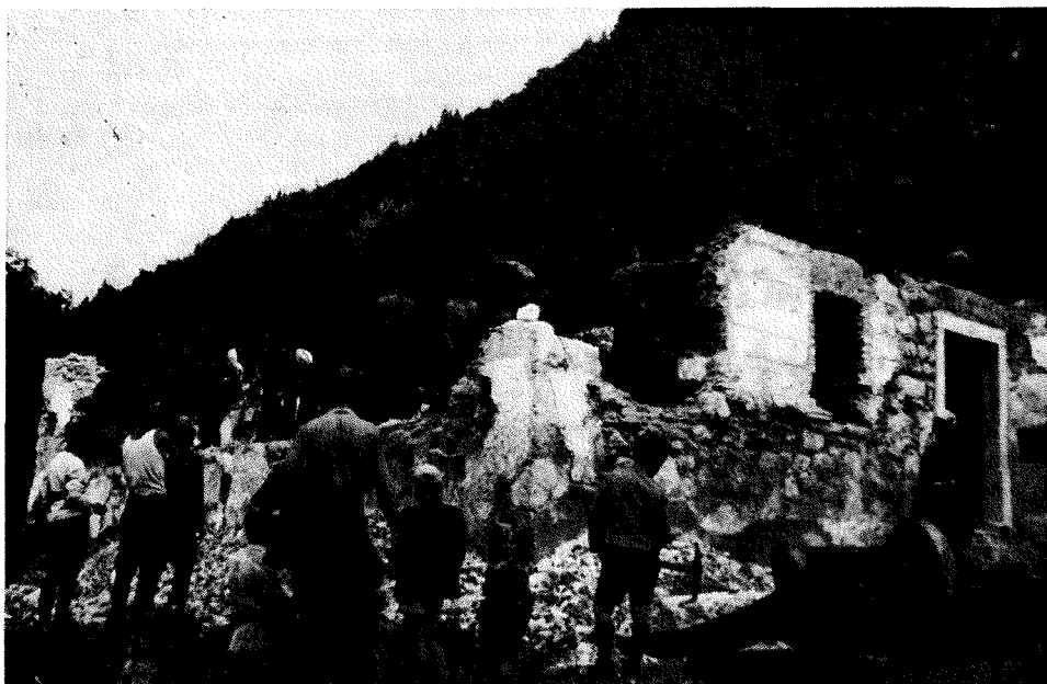
V nedeljo, 9. septembra 1945, so udarniki začeli odstranjevati ruševine v Rašici, prvi od Nemcev požgani slovenski vasi

vtisom grozot, ki so jih doživeli. Še vedno so videli pred seboj ustaše-krvnike, umorjene matere in brate, plavajoča trupla v Drini, goreče vasi. Niso še pozabili na trpljenje, ki so ga prestali na begu, v snegu in ledu, ko so si rešili le golo življenje. Tu je kazala vojna svoje najgrozotnejše posledice. Trpele so armade otrok, ne da bi mogle le približno dojeti in razumeti, čemu vse to trpljenje, čemu zločinstva, preganjanje in strah.