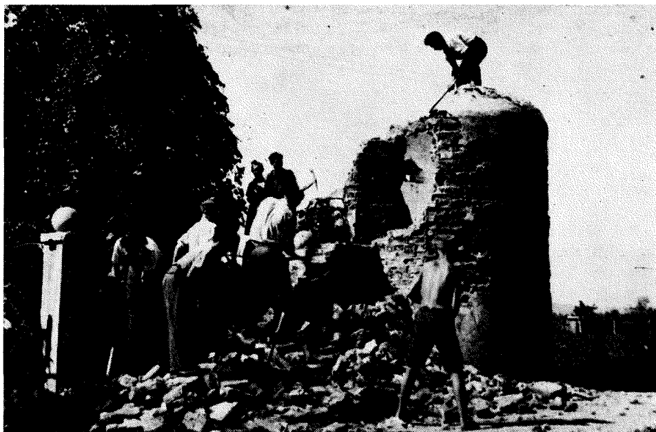
V splošnem udarniškem zagonu in tekmovanju so v nedeljo, 3. septembra 1945, množično nasokočili na ostanke vojne okoli Ljubljane

uredili delo, tovarne, odnose, plače, pokojnine. Vsi pa so bili pripravljene razmišljati o tem, sodelovati, delati.