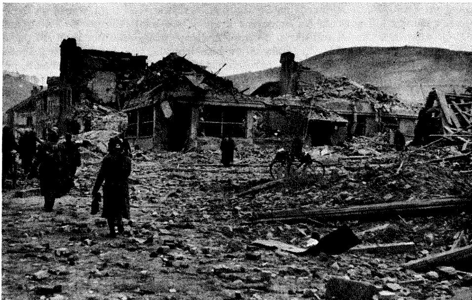
Ob bombnem napadu na Maribor 19. novembra 1944 je bilo popolnoma porušeno tudi poslopje carinske pošte in Glavnega kolodvora

je bil sestreljen štirimotorni bombnik, katerega osem članov posadke je bilo ujetih, dva pa sta se smrtno ponesrečila. Tretji napad na železniško postajo Moškanjci je bil izveden 23. marca, ko so trije lovski bombniki obstreljevali delavski vlak in pri tem težko poškodovali tri lokomotive. Človeških žrtev ni bilo, pač pa je bila ena oseba ranjena.