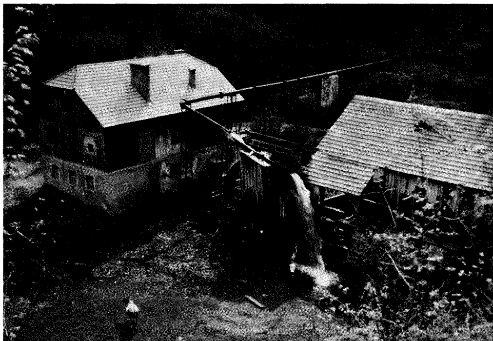
Radiodelavnica v Črmošnjicah, desno električna centrala