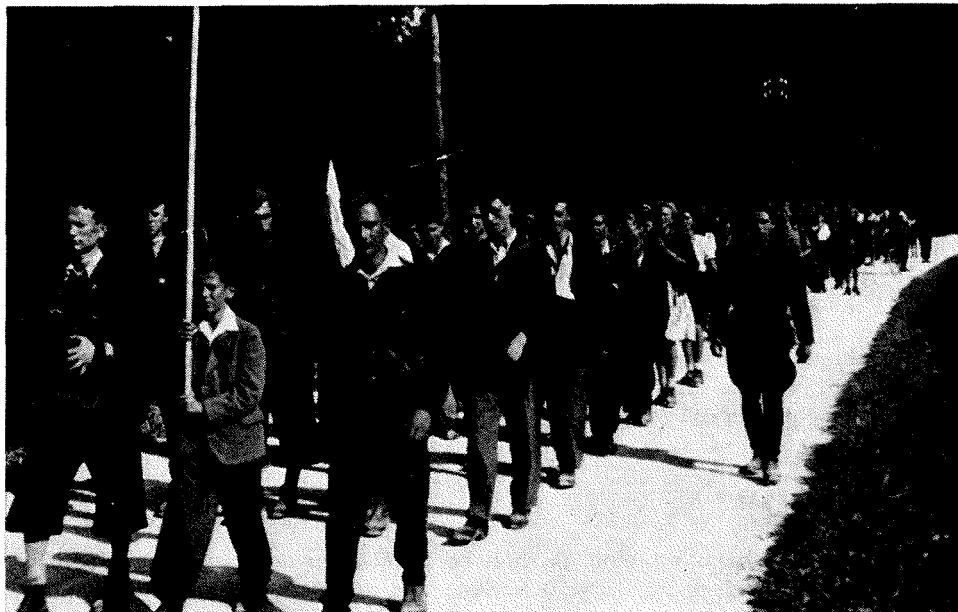
Druga delovna mladinska brigada se je zbrala v Bohinju 10. septembra 1945. Treba je bilo pripraviti drva za bližajočo se zimo

volj! Zločinska dejanja, ki se danes dogajajo pred našimi očmi na naših cestah, morajo takoj prenehati. Naše ljudstvo zahteva to! Zob za zob! To naj bo naše geslo proti takim divjakom. Ljudje, ki bodisi iz objestnosti, bodisi iz malomarnosti ali v pijanosti v mirnem času, v normalnih razmerah, na javnem prometnem prostoru ubijajo ljudi, niso nič boljši od zahrbtnega razbojnika.«