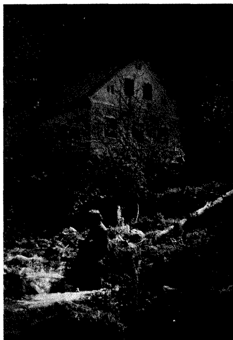
Radiodelavnica v Starih Žagah, kasneje javka 99 d