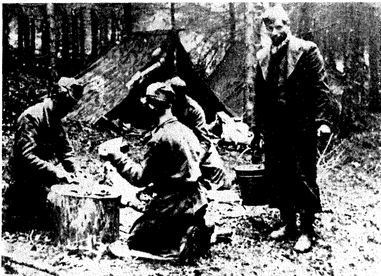
Taborišče Šercerjevih partizanov na Pokojišču

Naj navedemo še nekaj bojnih akcij Šercerjevih partizanov na teritoriju naše občine, kakor jih kronološko navaja operativni dnevnik prvega bataljona Ljube Šercerja.