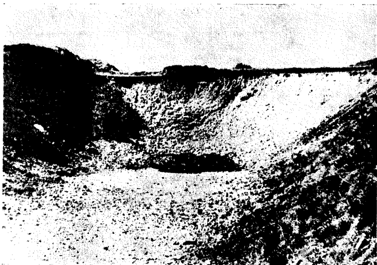
Gramozna jama, kraj, kjer so okupatorji streljali slovenske rodoljube