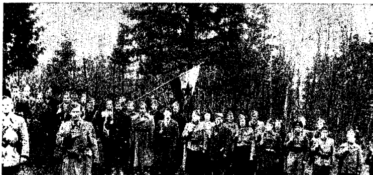
Druga četa prvega bataljona Dolomitskega odreda

gardistov je tudi bila širiti malodušje in nezadovoljstvo med ostalimi belogardisti. Najbolj so si partizani prizadevali, da bi te ljudi čim prej potegnili iz bele garde, da bi odšli v partizane. Z nekaterimi Starovrhničani, ki so bili v Zaplani, so se že dogovorili za javko, kamor naj bi prišli. Toda oportunistem je tudi tokrat zmagal. Partizani so zastonj prišli na javko. Pač pa je po kapitulaciji Italije veliko teh, ki so bili v belo gardo prisilno mobilizirani, odšlo v partizane, zlasti z Vrhnike.