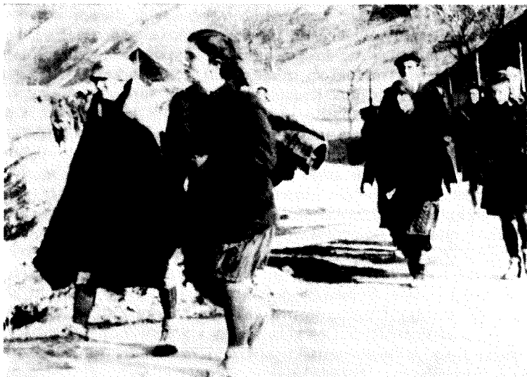
Italijani in belogardisti vodijo ujete partizane in civiliste v Dobrovo