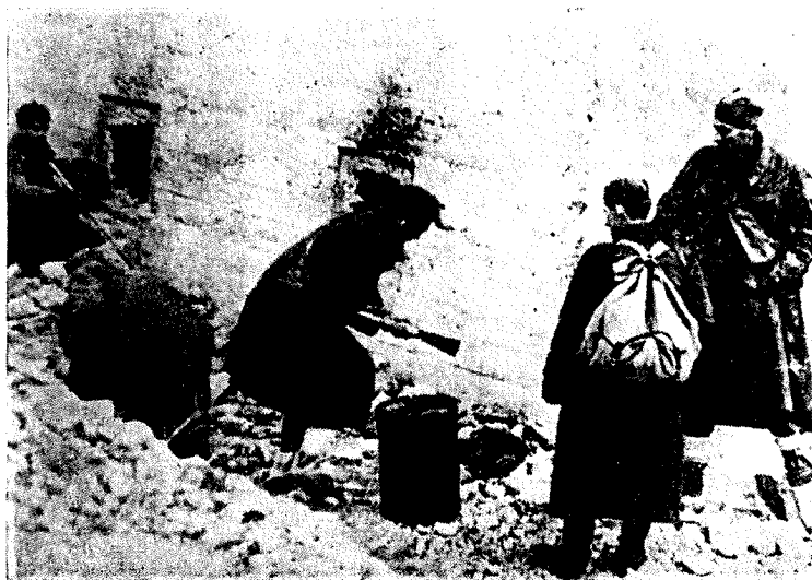
Miniranje Štampetovega mostu