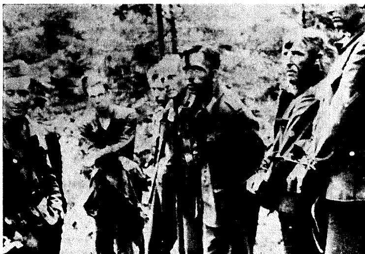
Pri Goričici ujeti Nemci

nadaljevali pohod do Rakeka. Italijanska komanda je sicer protestirala, toda pomagalo ni. V severni Italiji, v Slovenskem primorju in v Ljubljanski pokrajini so Nemci imeli do konca avgusta že osem divizij in samostojno brigado.