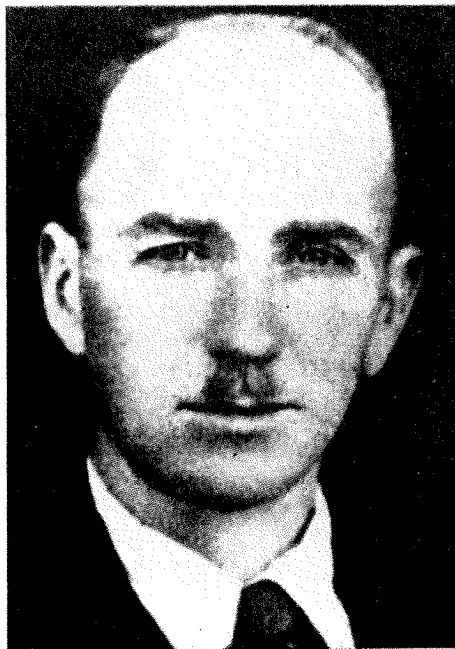
Narodni heroj Voljč Ignac, padel na Stajerskem l. 1944

teval, se reče, da bi dvignilo ljudske množice k splošnemu uporu. Potrebna je bila trdna organizacijska mreža, ki bi zajela slehernega poštenega Slovenca na Vrhniki, v Borovnici in po okoliških vaseh. V vsakem kraju je bilo potrebno postaviti organizacijo Osvobodilne fronte. Pri tem delu se je bilo treba nasloniti na tista napredna gibanja, ki so že pred vojno dramila zavest delovnih ljudi. V prvi vrsti je bila to Komunistična partija, saj je ta z vsem dotedanjim delom dokazala, da se bori za koristi delovnih ljudi.