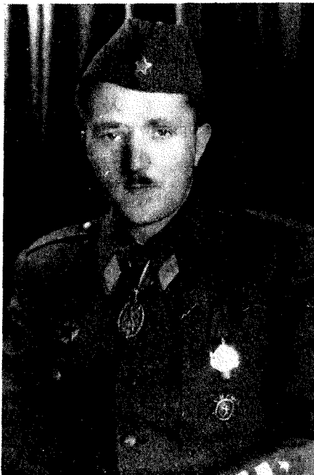
Narodni heroj Tone Vidmar-Luka

Verd. Partizani so imeli namen zavzeti postajo, ustaviti tovorni vlak in ga potem z vso hitrostjo spustiti proti Borovnici. Ker je bil most razmajan in nova konstrukcija pritrjena kar na stare stebre, bi se verjetno zaradi velike hitrosti vlaka močno poškodoval ali pa celo zrušil, saj so vozili drugi vlaki po njem z najmanjšo hitrostjo. Ta načrt pa se ni posrečil, ker so borci kašljali in jih je patrolja prekmalu opazila. Vrgla je bombo in tako alarmirala celotno posadko. Pričela se je borba. To je bilo 2. februarja ob 0,15 uri. Partizani so napadli posadko, kjer je bilo 19 mož