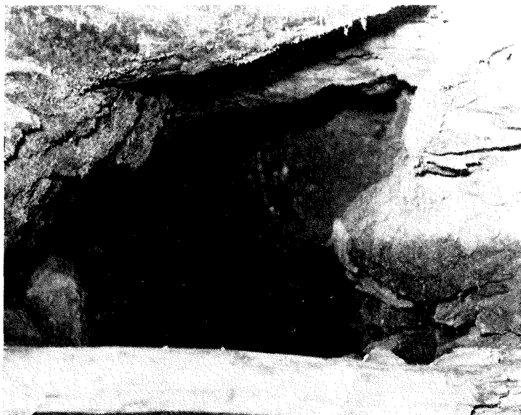
Jama v Celarjih, taborišče vrhniških partizanov spomladi l. 1942

vsega onemoglega so ga gnali kazat Bradešku, da je potrdil, da je pravi, nato pa proti Vrhniki. Spotoma so ga ustrelili.«