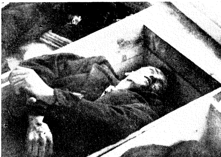
Postreljene žrtve preserskega procesa