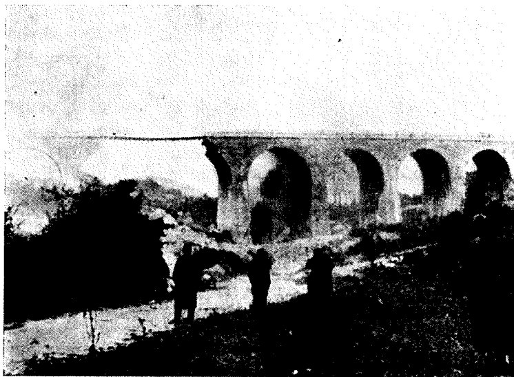
Stampetov most po razstrelitvi

Medtem so se minerji z mulami približali mostu. Ko so hoteli zložiti eksploziv poleg kolone, je udarila granata brzostrelnega topa v eksploziv na neki muli. Ta je eksplodiral, bilo je več mrtvih in ranjenih, pobitih 5 mul in uničen eksploziv na njih. K sreči je bilo na Tolstem vrhu še od zadnjega napada na most skritega okrog 800 kg eksploziva. Hitro so ga pripeljali od tam. Ko pa so skušali minerji minirati drugi obok mostu, je mednje ponovno priletela granata in zopet povzročila žrtve.