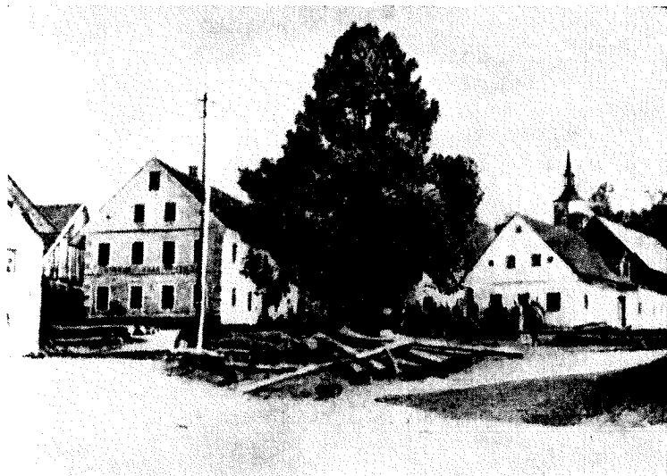
Bezuljak ob italijanski okupaciji

Ko je že divjala italijanska ofenziva, so partizani izvedli do tedaj največjo akcijo v Ljubljanski pokrajini: napad na Lož in Bezuljak. Akcijo je vodil Ljubo Šercer. Lož so napadli partizani 19. oktobra ob pol petih popoldne (Robska, Preserska in Loška četa), Bezuljak pa ponoči med 19. in 20. oktobrom. Ker je Bezuljak napadala Borovniška četa, si oglejmo, kako so se dogodki odvijali med napadom in po njem. Glavni cilj je bil skladišče razstreliva v gasilskem domu. Hkrati pa so partizani napadli tudi hiše, kjer so stanovali italijanski vojaki, podoficirji in oficirji, da le-ti ne bi mogli napadenim v gasilskem domu na pomoč in da so sovražniku pobrali orožje. Vsa akcija je trajala 10 do 15 minut. Partizani so odnesli rastreliva, kolikor so ga mogli, vse drugo je zletelo v zrak (okrog 1500 kg eksploziva). Po italijanskih poročilih so Italijani imeli 3 mrtve in 7 ranjenih, bržčas pa so bile njihove žrtve večje, ker so jih partizani presenetili speče in so jim skozi okna nametali bomb. Tone Vidmar navaja, da so imeli Italijani 32 mrtvih.