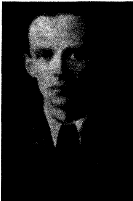
Rode Franc ubit od četnikov l. 1943

Kaže, da jim kljub vsemu temu Nemci niso popolnoma zaupali. Četniki so ostali na Stari Vrhniki samo nekaj mesecev. Potem so se morali preseliti v domobransko postojanko na Vrhniko. Nemci pa so razstrelili stražni bunker na vrhu starovrhniškega griča.