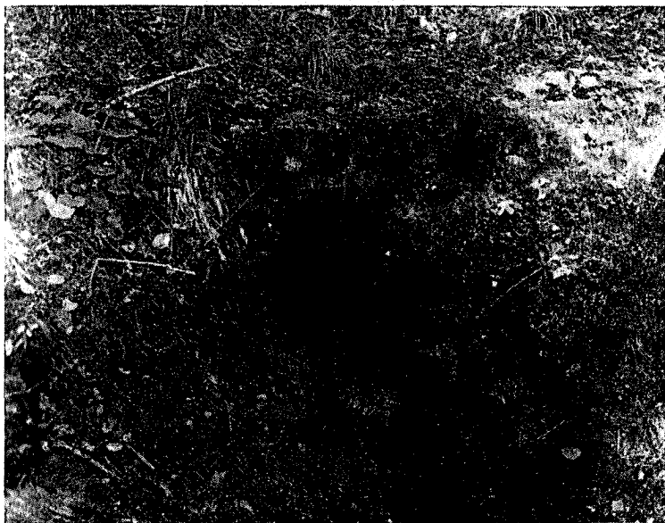
Bunker v Češmelu

je zelo ozek, težko se je bilo splaziti noter, proti koncu pa se jama razširi in je v njej prostora za več kakor deset ljudi. V tej jami so se aktivisti zadrževali do osvoboditve.