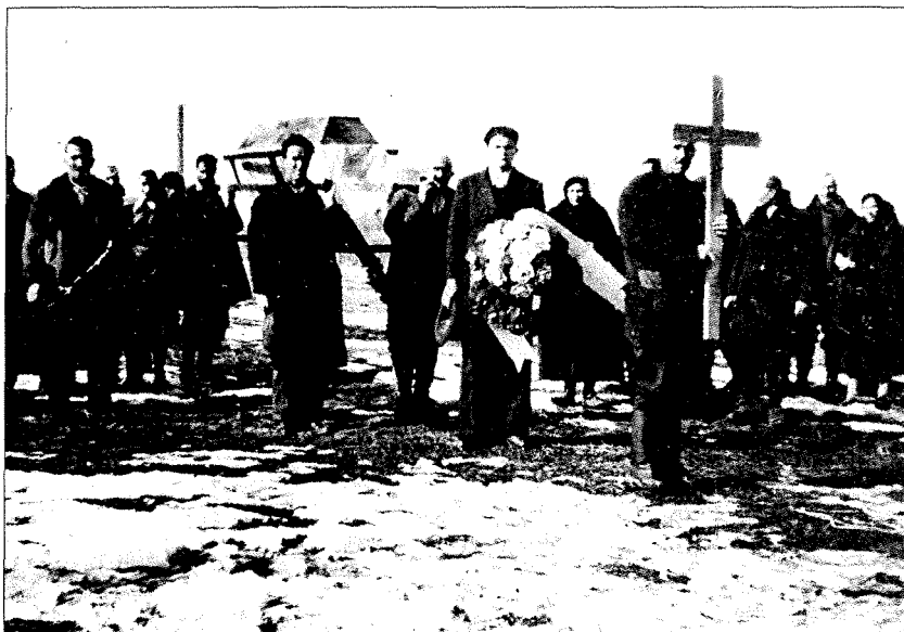
Zadnja pot interniranca.

Internacijsko taborišče Šarvar je širši slovenski javnosti malo znano iz dveh razlogov: prvič, ker je bila za razmere druge svetovne vojne majhno in so Slovenci tvorili manj kot eno desetino vseh internirancev v njem, kjer so bili skoraj izključno Jugoslovani, drugič, ker se je o njem po vojni izredno malo pisalo. Dolgo potem, po štiridesetih letih po vojni, so se v javnosti sicer pojavili manjši in širši opisi, ki so pa eni manj drugi bolj daleč od resničnosti in so v javnosti napravili več škode kot koristi. Pisali so brez argumentov po pripovedovanju drugih ali po spominu, ki je zaradi časovne odmaknjenosti močno zbledel. Zato so si pisci takratnih razmer in dogodkov v tem taborišču prikrojili tako, kakor si sedaj zamišljajo, da je bilo, ali pa so slišali kako je bilo v drugih taboriščih in so sedaj prepričani, da je tudi v Šarvaru bilo tako. To velja posebno za tiste, ki so - nekateri kot otroci - prebili v taborišču le nekaj mesecev in vedo o njem zelo malo. Pri opisovanju gredo v dve skrajnosti: eni ga opisujejo kot taborišče grozot in smrti, drugi, to so predvsem tisti, ki so ga kot turisti prvič videli po vojni, pa pravijo, da to pravzaprav ni bilo internacijsko taborišče, ampak da je bilo bolj podobno zatočišču v vojnem času. Danes mogoče res izgleda tako, ker je preurejeno, prezidano in dozidano tako, da so v njem tri proizvodna podjetja in niti malo ni podobno iz časa vojne. Eni govorijo o 6.000 internirancih, drugi o