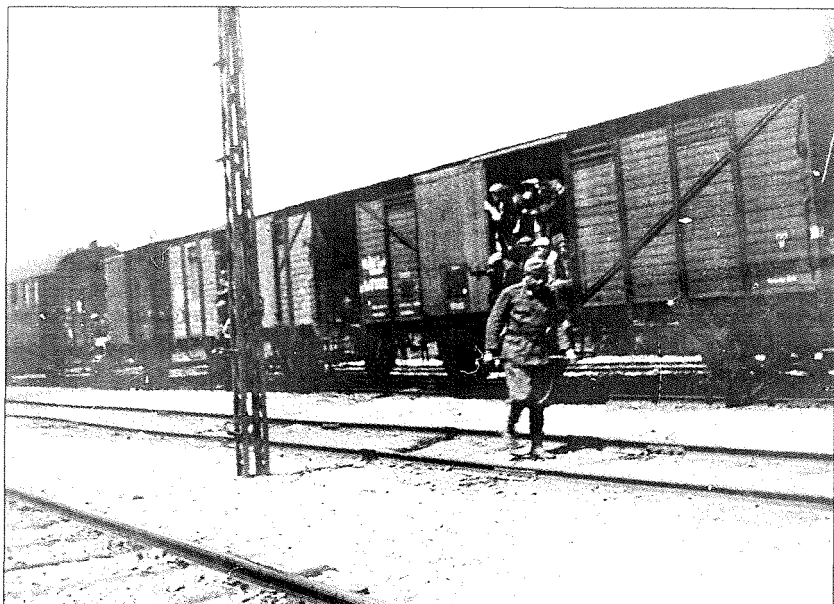
Prihod v taborišče - tako so pripeljali internirance v taborišče.

taborišča. Razvrstili so nas ob robu ceste in po ne vem kolikokratnem preštevanju le ugotovili, koliko nas je in da smo prispeli vsi, kolikor nas je na spisku.