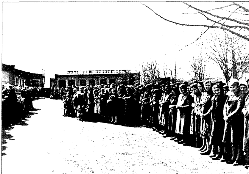
Zbori internirancev ob prihodu delegacij oz. višjih funkcionarjev oblasti v taborišče.