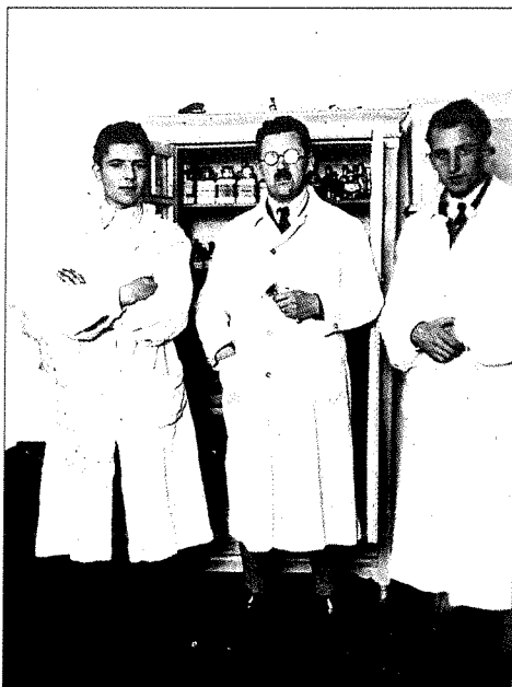
Zdravstveno osebje taboriščne ambulante.

jih je borilo tudi na sremski fronti, od koder se prenekateri ni vrnil. Tudi med tistimi, ki so leta 1943 odšli iz taborišča v Nezavisno državo Hrvatsko, je bilo pozneje nekaj aktivnih borcev NOV.