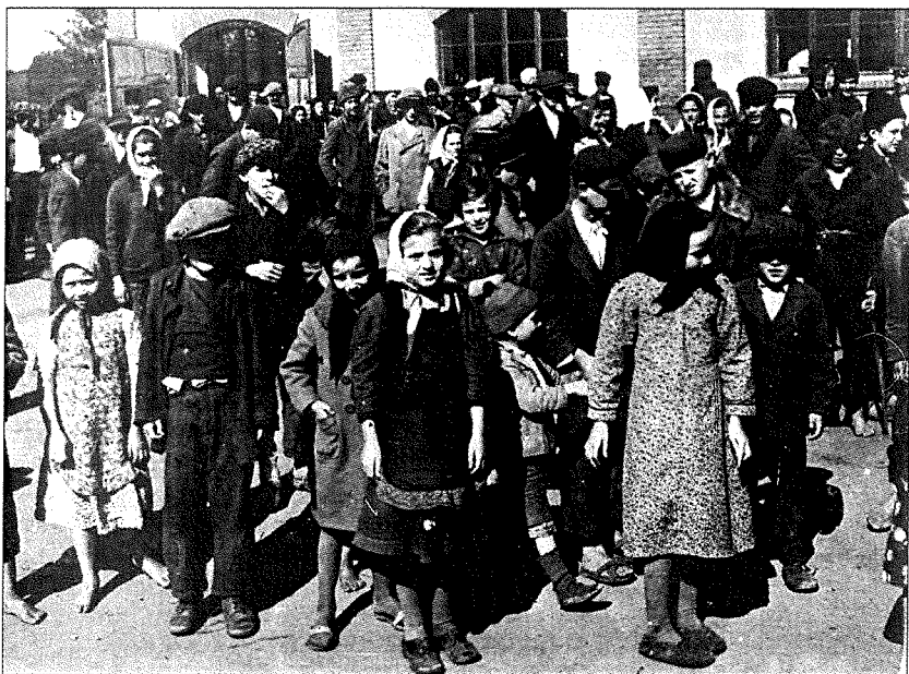
Med interniranci taborišča je bilo veliko število otrok.

Razmere v taborišču so bile take, da je celo zloglasni komandant »Bradonja«, ki se s pretepanjem ni ustavil niti pred otroci in nosečimi ženami ter materami z dojenčki v naročju, pred svojo premestitvijo zahteval od cerkvenih oblasti v Bački, naj za potrebe taborišča Šarvar pošljejo slamo za ležišča, ker so to zimo interniranci ležali na golih deskah. Da ne bi te ljudi tudi naslednjo zimo doletela ista usoda, naj cerkveni odbori Srbske pravoslavne cerkvene občine preskrbijo večjo količino slame in jo pošljejo v Šarvar. Taboriščna komanda nima možnosti ta material nabaviti.