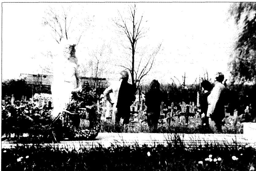
Taboriščno pokopališče s spomenikom - sedanji izgled.

Ustavili so naju sovjetski vojaki in celi dan smo morali nakladati na kamione sode nafte. Zvečer so nama dali večerjo in vsakemu po nekaj milijonov, ali celo milijard nemških mark. Ponoči, oziroma proti jutru, ko so vojaki spali, sva zbežala in nadaljevala pot proti Celdómólku. Čim sva prišla do mesta, naju je opazil vojak in poklical k sebi. Takoj je zastavil že znana vprašanja: kam greva, kakšne narodnosti sva ali imava dokumente. To so bila takrat standardna vprašanja sovjetskih vojakov - prometnikov. Ko sva mu na vse odgovorila in sem mu pokazal jugoslovansko delavsko knjižico, ki sem jo imel pri sebi, kjer je pisalo tudi v cirilici, je pohvalil Jugoslovane in naju pospremil v bližnji park. Začudilo naju je to, da je na vhodu stal stražar. Notri sva ugotovila, da je park ograjen z bodečo žico. Bil je poln ljudi raznih narodnosti. Od skupine Italijanov sva zvedela, da je to zbirno taborišče in ne vedo kam in kdaj jih bodo odpeljali. Sklenila sva čim prej zbežati. V ograji sva našla luknjo, skozi katero so verjetno že pred nama nekateri zbežali. Ponoči sva tod ušla in precej daleč stran skrita počakala, da se je zdanilo. Uvidela sva, da bodo po tej poti ljudje težko in dolgo potovali do doma.