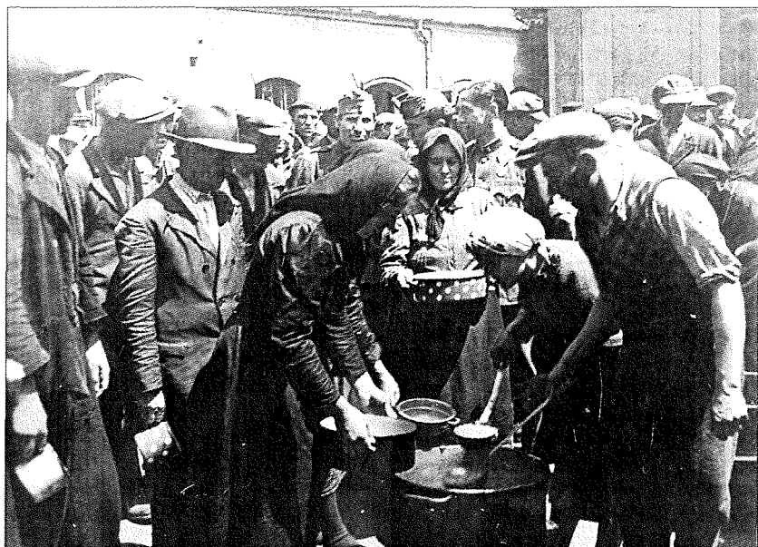
Delitev hrane v taborišču.