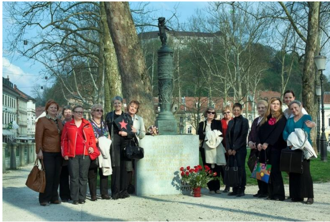
1. ženski spomenik pred Kazino.