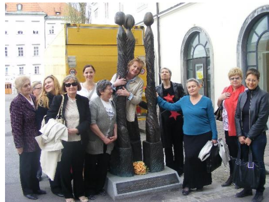
3. nadomestni ženski spomenik