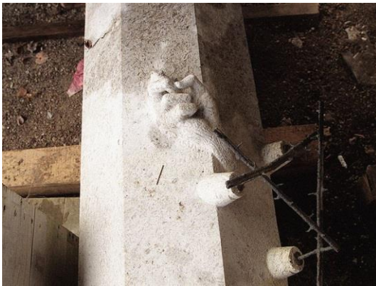
3. ženski spomenik Spomenik na »popravilu« (ima že odbit moteči kazalec).